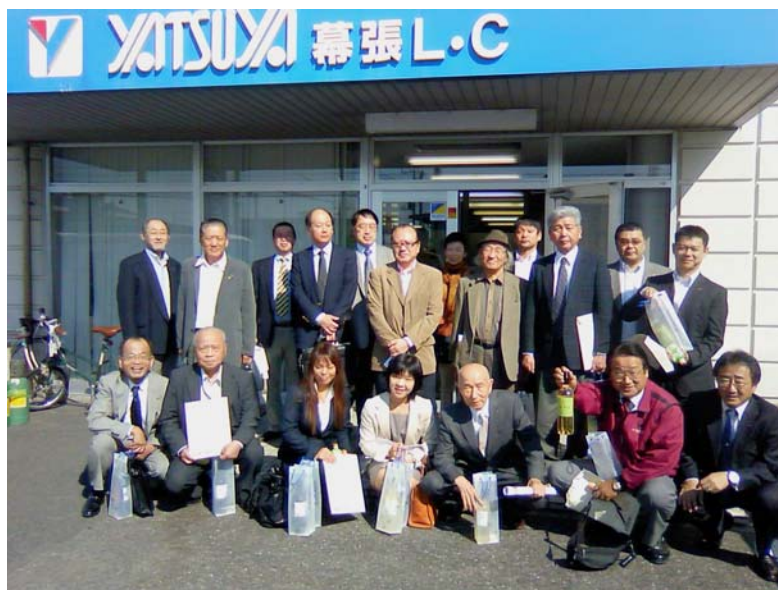
職場訪問 場所：「(株)やつや物流センター」(玄関前で集合写真)